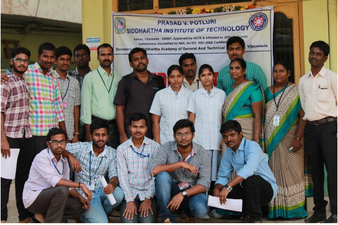
NSS Volunteers with the medical staff