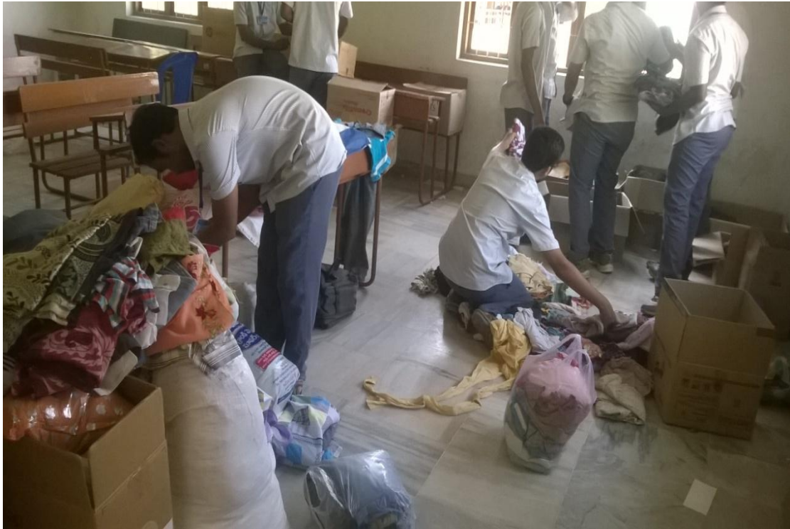
Volunteers dividing the items collected from donors