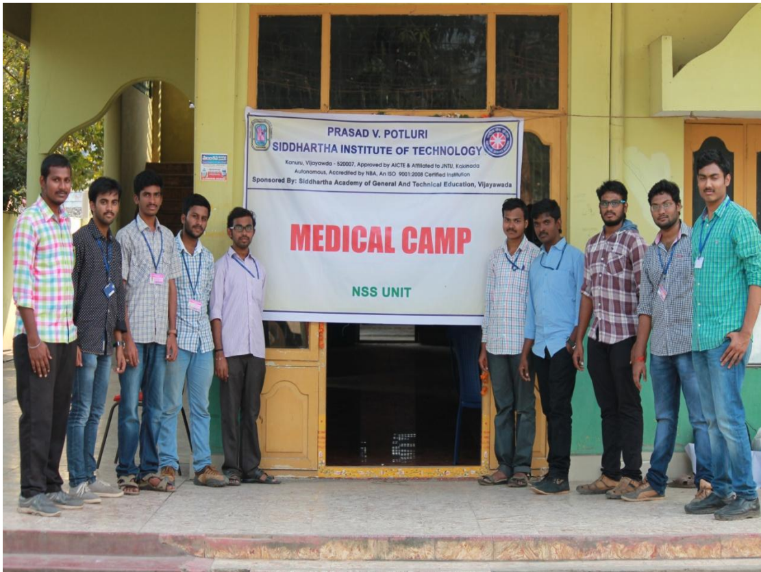
NSS Volunteers who made the camp successful