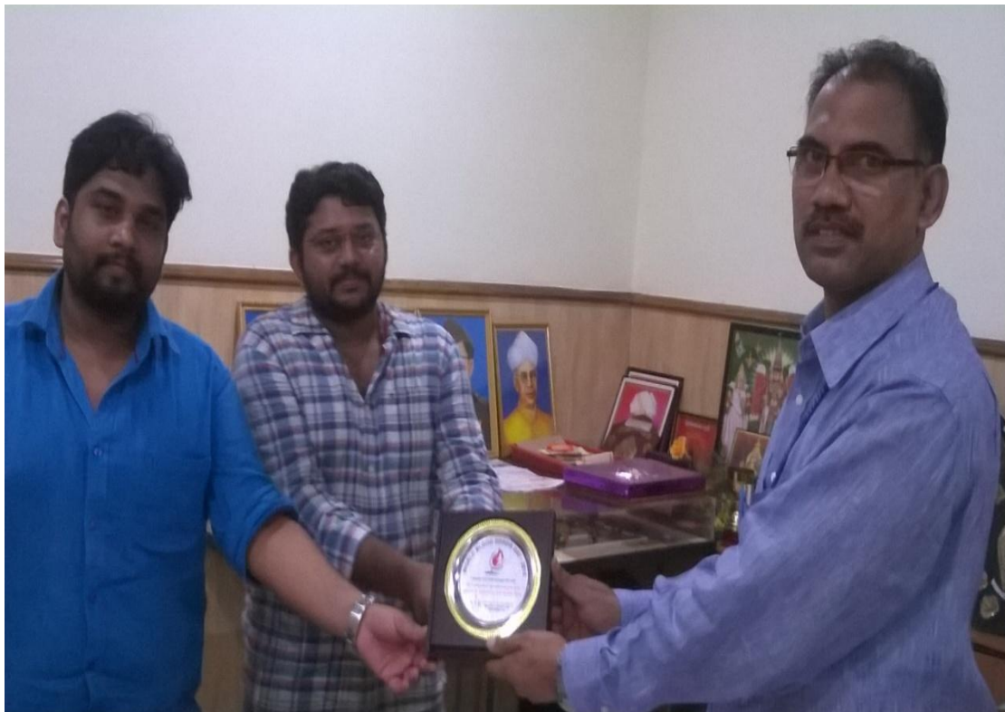
The representatives of NTR Trust, Guntur, commemorating the Principal and NSS Unit